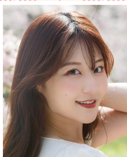
佐々木 美乃里 Minori Sasaki 2024年公開映画 「さよならは5月の風のように」主演女優 NBGF所属